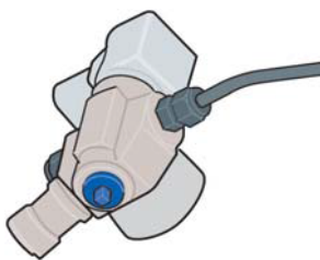
Ręczny zawór odcinający na zaworze głównym zbiornika